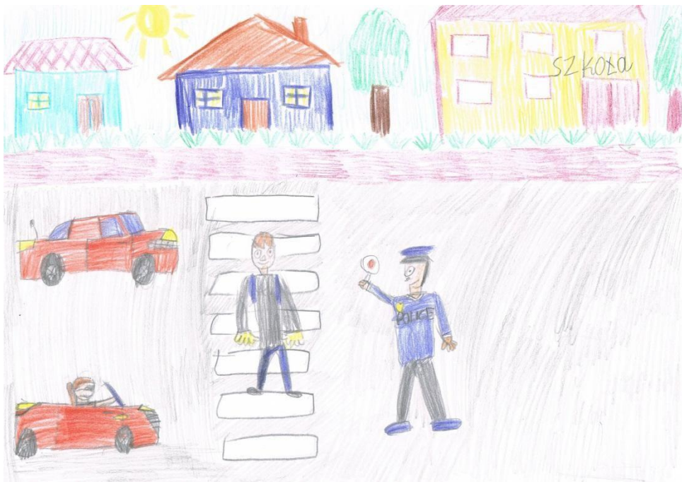
Rysunek 4 II miejsce Filip Toma klasa 1c