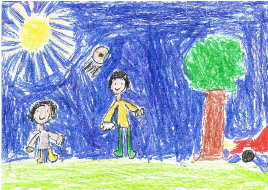
Rysunek 3 I miejsce Kacper Jabrzyk klasa 1b