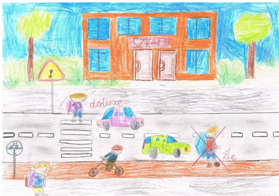
Rysunek 5 III miejsce Hubert Mikułowski klasa 1c