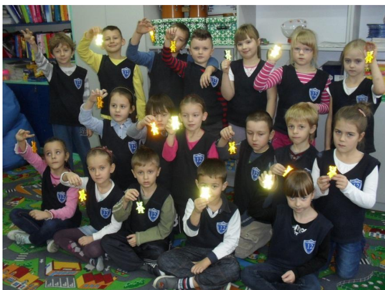
Rysunek 2 Dzieci z odblaskami na plecaki.

Po zajęciach dzieci otrzymały odblaski na plecak.