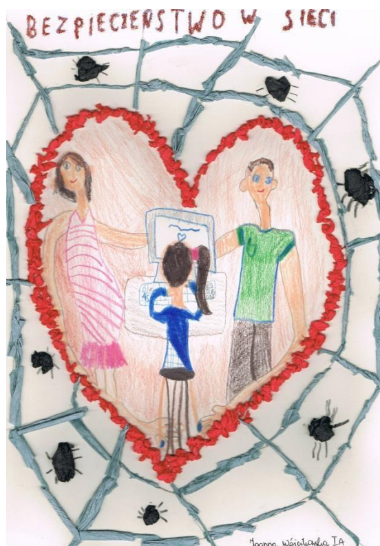
Rysunek 4 I miejsce Wójcikowska klasa 1a