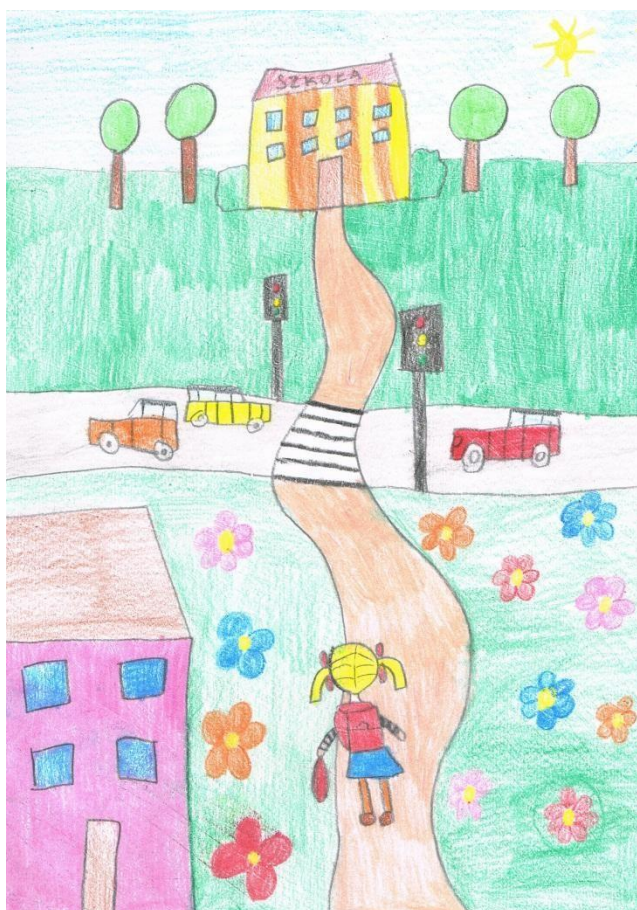
Rysunek 5 III miejsce Patrycja Dziubałowska klasa 1a