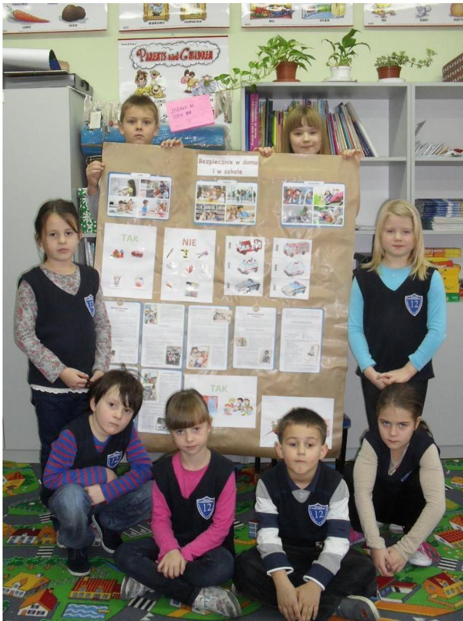
Rysunek 1 Dzieci z wykonanym plakatem.

Ważnym elementem programu były też dodatkowe zadania znajdujące się na stronie internetowej